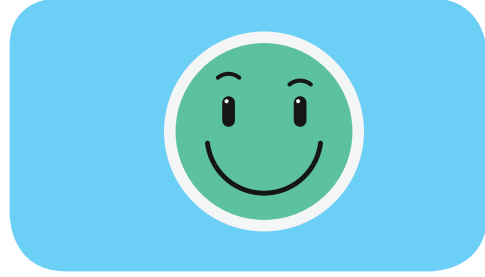
Kartın Arka Yüzü